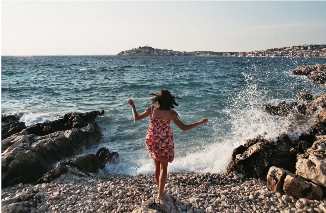
여행을 입다 / WEAR WHERE YOU AT!